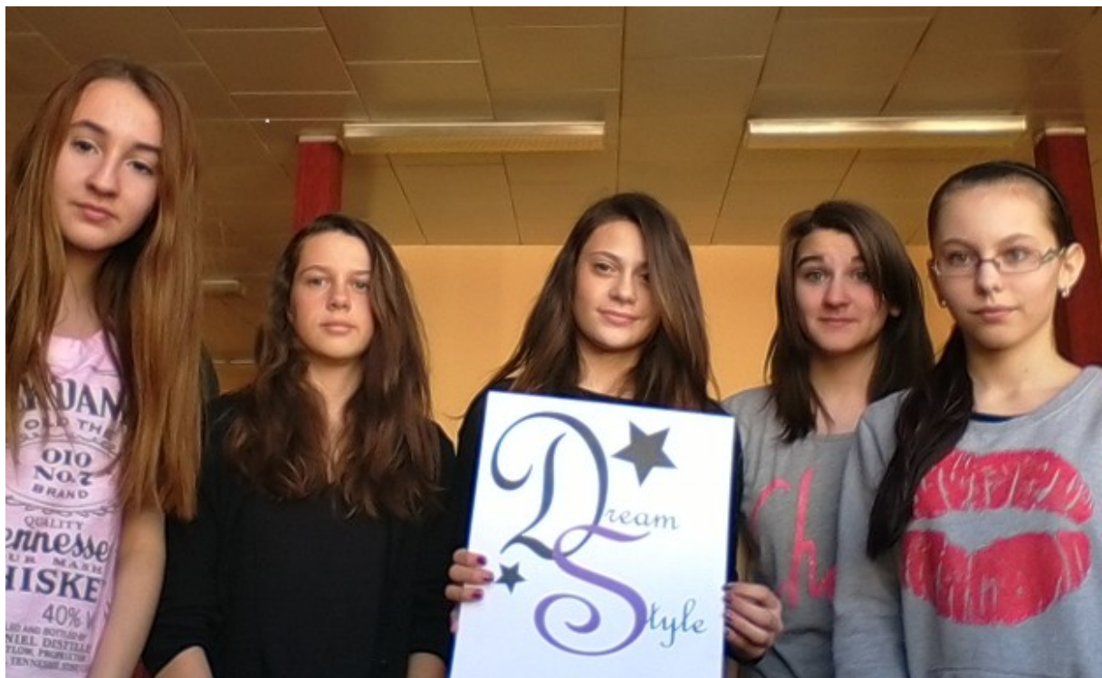
Obr. 11.: Vedení fiktivní firmy DreamStyle: