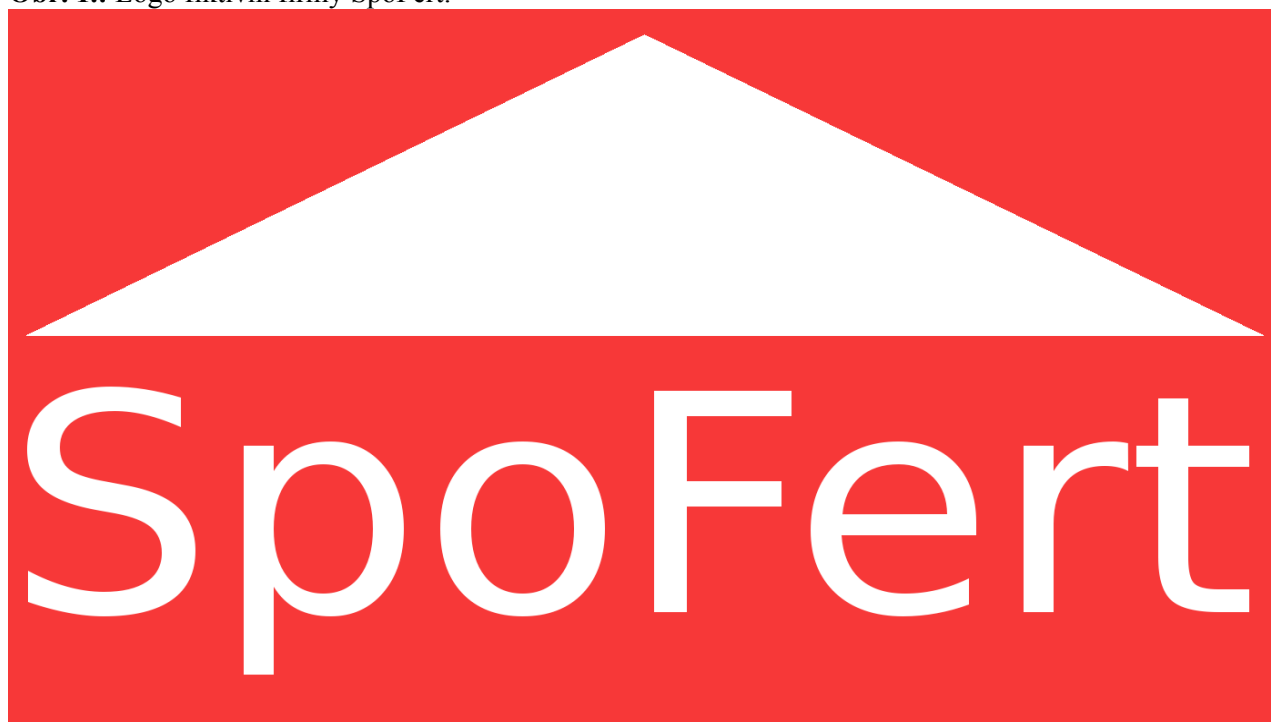
Obr. 1.: Logo fiktivní firmy SpoFert:

Před samotným vytýčením předmětu podnikání bylo provedeno několik aktivit k rozpoznání zájmů žáků navštěvující tento zájmový útvar. Nejprve byl studentům předán k vyplnění krátký dotazník, v němž měli za úkol jednotlivě sepsat obory jejich zájmů. Po zjištění těchto atributů se žáci seznámili s principem marketingového průzkumu trhu, který obecně zjišťuje zájem či nezájem veřejnosti v daném městě / obci o konkrétní službu či produkt, srovnává kvalitu nabízených služeb/statků u již fungujících společností či porovnává cenovou hladinu těchto firem a soukromníků. Žáci si ve spojení s jejich osobními zájmy utvořili skupiny, v nichž měli za úkol sestavit jednoduchý marketingový průzkum trhu ve městě Ždírec nad Doubravou. Výsledky jejich práce byly představeny na jedné z hodin zájmového útvaru. Na základě těchto poznatků se žáci spojili do dvou početně srovnatelných skupin z nichž se vyčlenily dvě fiktivní firmy (SpoFert – Miloš Havel, Dreamstyle – Nikola Vašková).