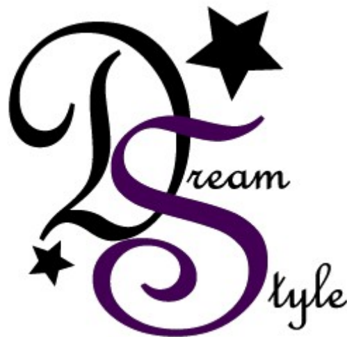
Obr. 9.: Logo fiktivní firmy DreamStyle

Další zajímavou exkurzí byla návštěva České Národní Banky. Prezentací a krátkým animovaným filmem se žáci seznámili s významem a cíli ČNB a bankovní radou. Samotná exkurze proběhla 13. 11. 2014. Žáci měli možnost shlédnout stálou expozici ČNB „Lidé a peníze“, která je umístěna v prostorách bývalého trezoru. Expozice nabízí historii vývoje peněz od pazourků k digitálním penězům a čipům. Prezentuje ucelený vývoj měny a financí v Čechách včetně vývoje ČNB od jejího založení. Je zde připraveno 65 vitrín s unikátními exponáty a platidly, padělky a ukázky ochrany peněz, interaktivní dotykové obrazovky, rozsáhlé informace v multimediálních počítačích a mnoho dalších zajímavostí.