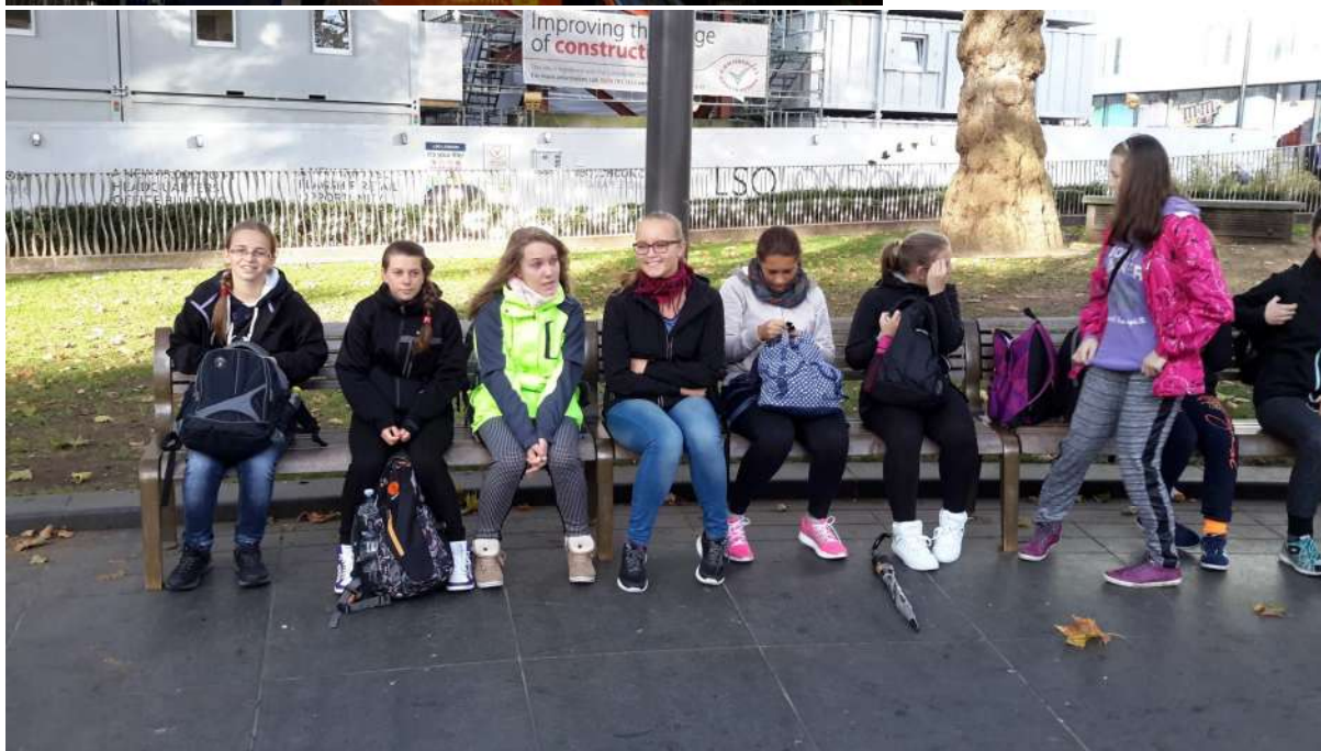
náměstí Piccadilly Circus - nákup suvenýrů