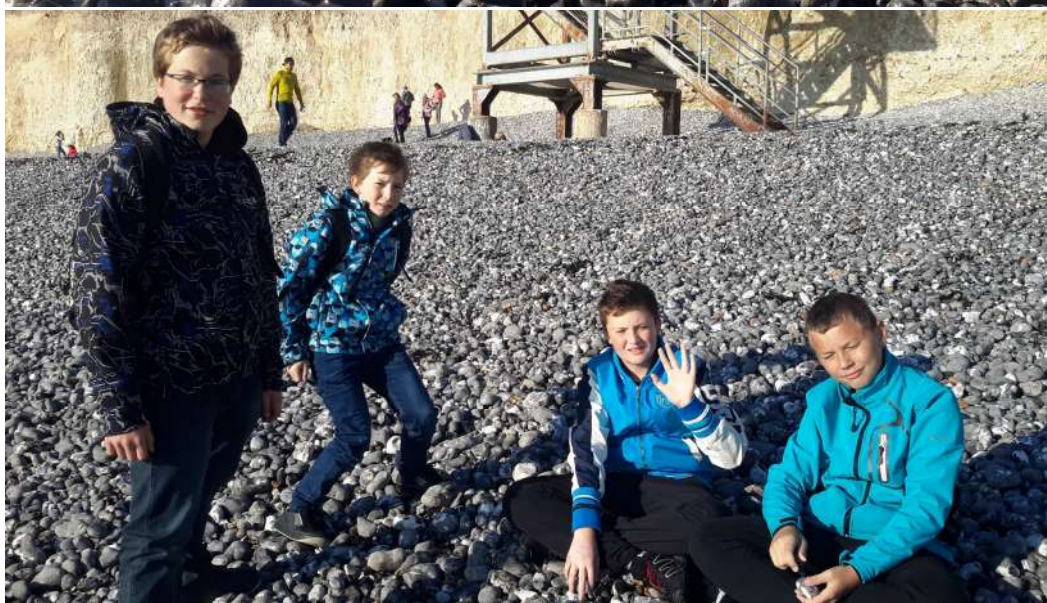
- ztracený vypnutý mobil se hledal velmi obtížně