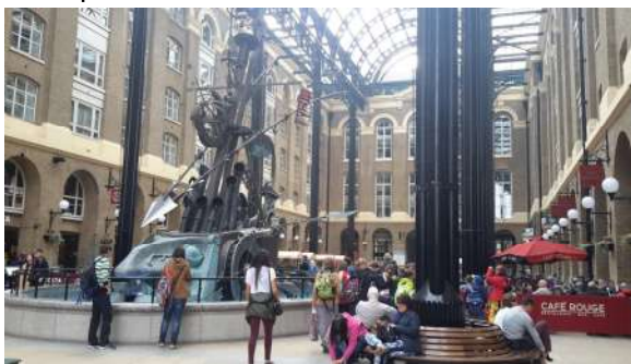
Finanční čtvrť v mlžném oparu