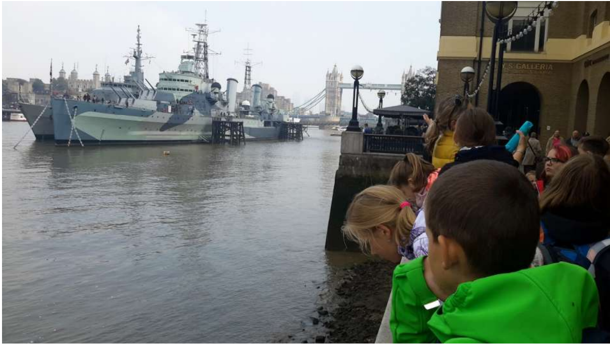
Nákupní centrum u Temže