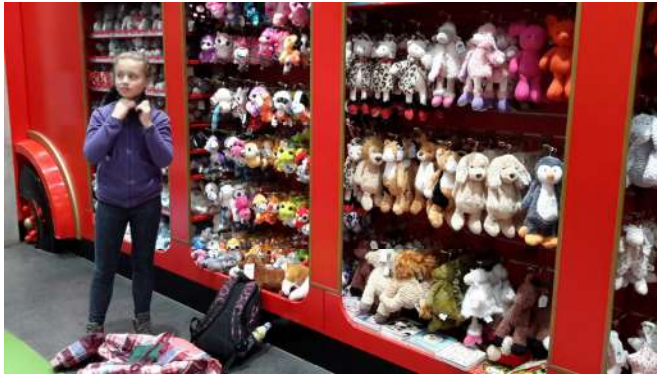
Buckingham Palace, oficiální londýnské sídlo britského panovníka, rezidence královny Alžběty II., místo oficiálního uvítání hlav států - socha královny Viktorie