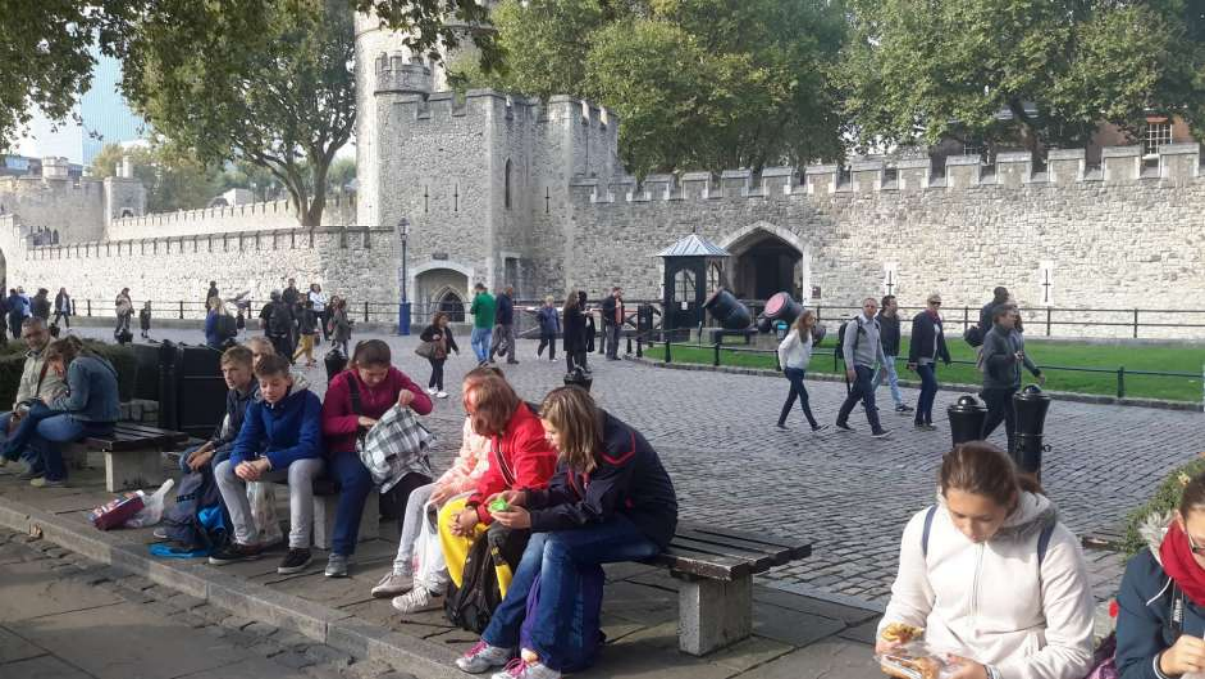
St. Catherin's Pier