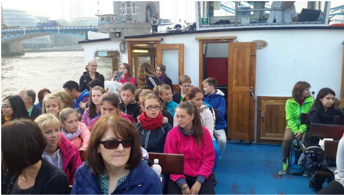
Dock Lands - bývalá loděnice přestavěná na luxusní byty