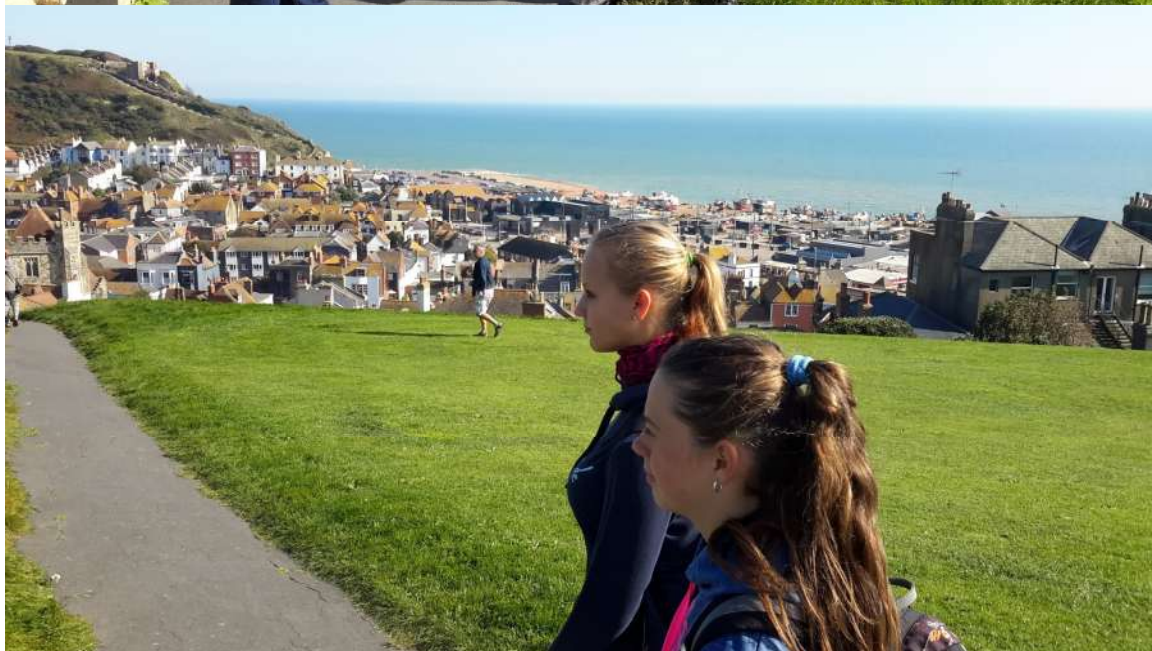
Lanovka na West Hill