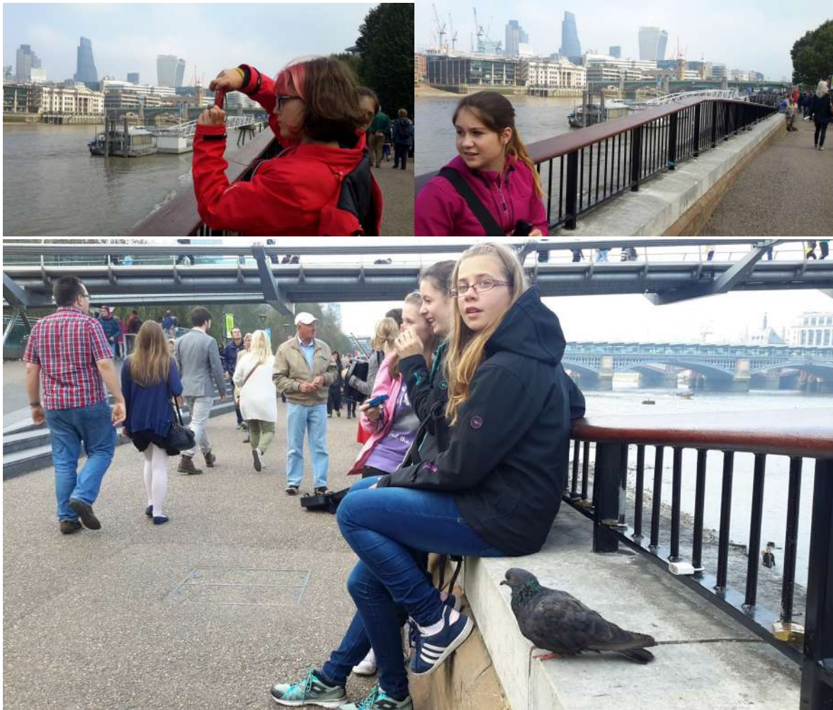
Globe Theatre - divadlo W. Shakespearea