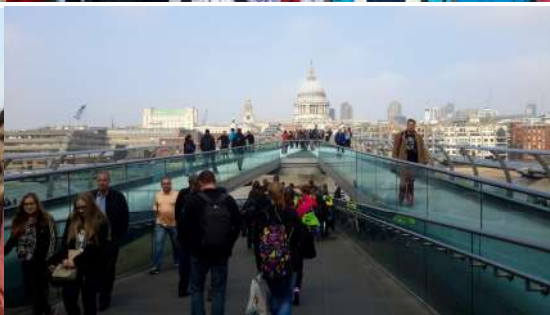
Pohled na Walkie Talkie a další mrakodrapy