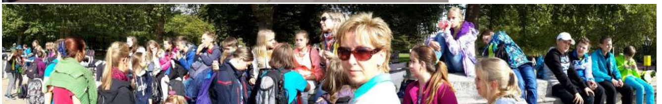
- královská garda