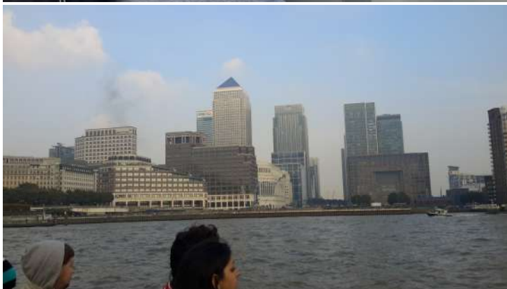
Royal Naval College