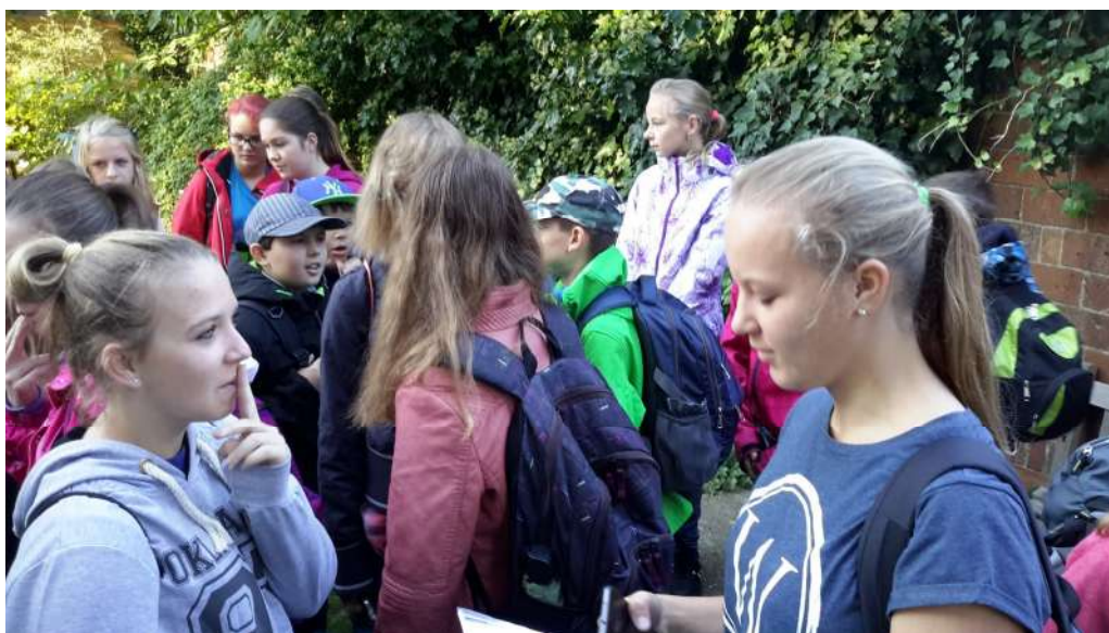
- rozdělení žáků do skupin