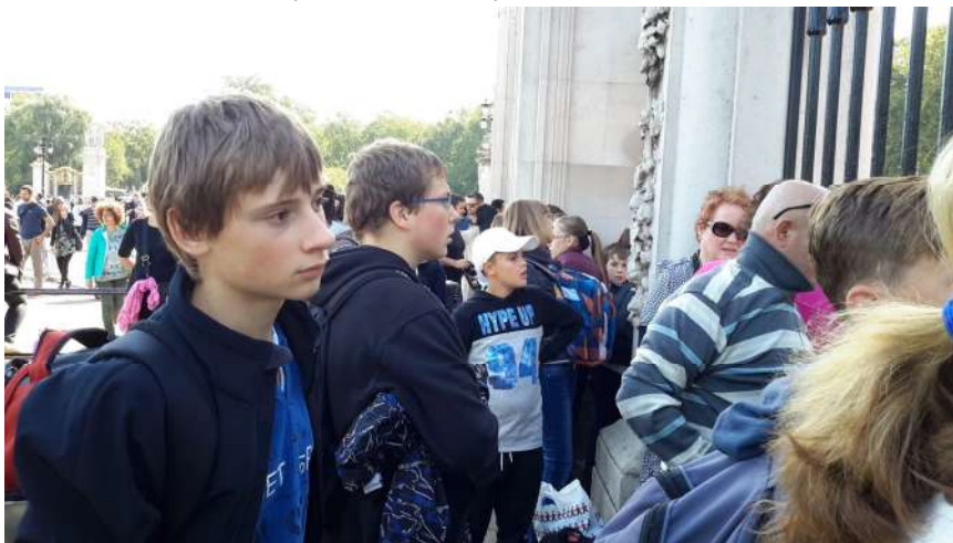
- nádherné počasí po celý den