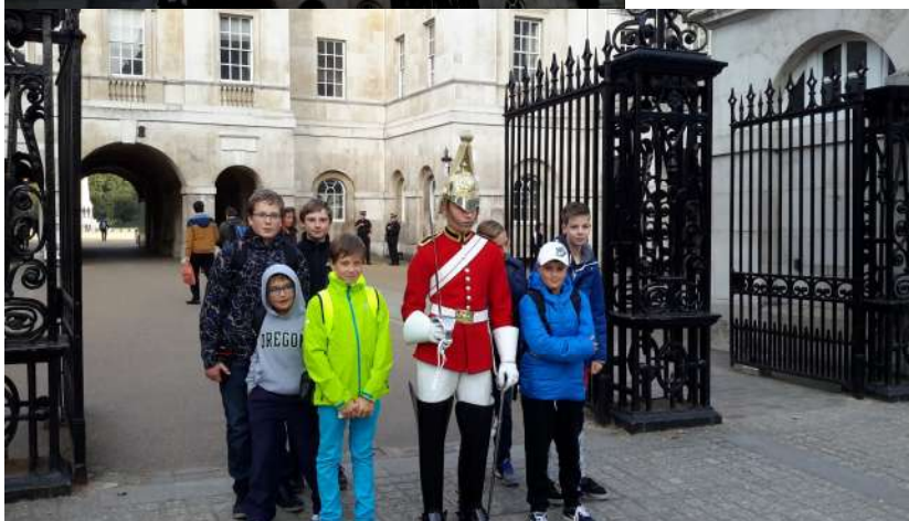
Trafalgar Square - Nelsonův sloup