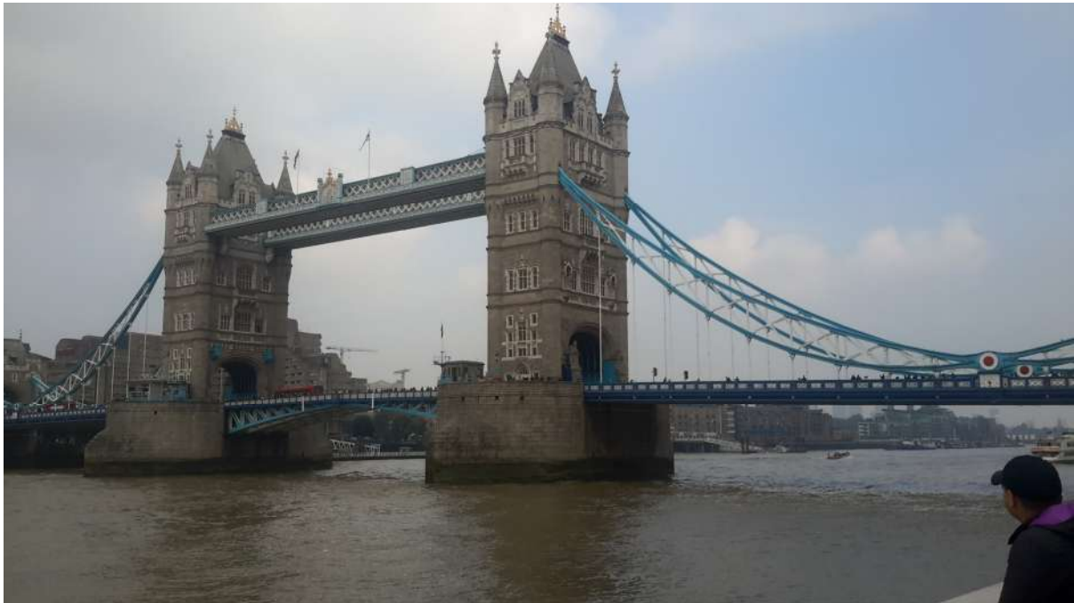
Tower Bridge je zvedací most nad řekou Temží