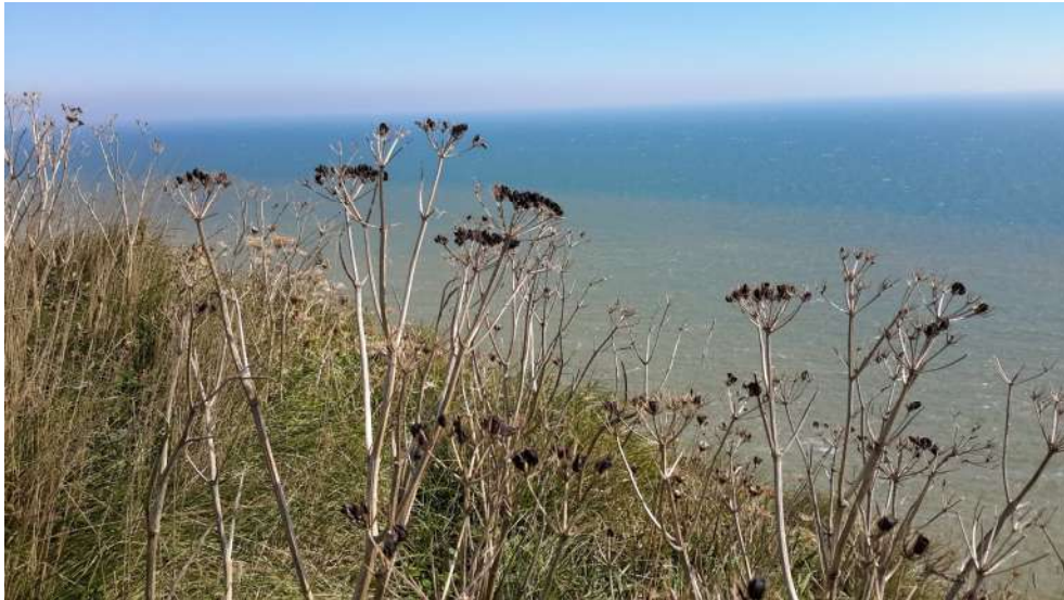
- mys s majákem Beachy Head