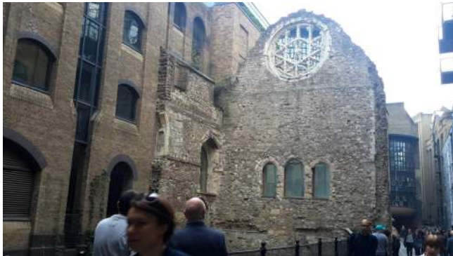
Kostel na Cathedral Street