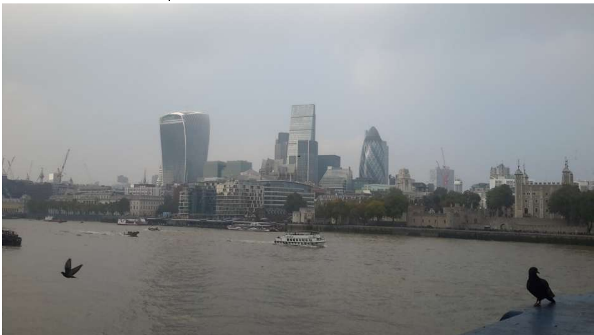
The City Tower Bridge