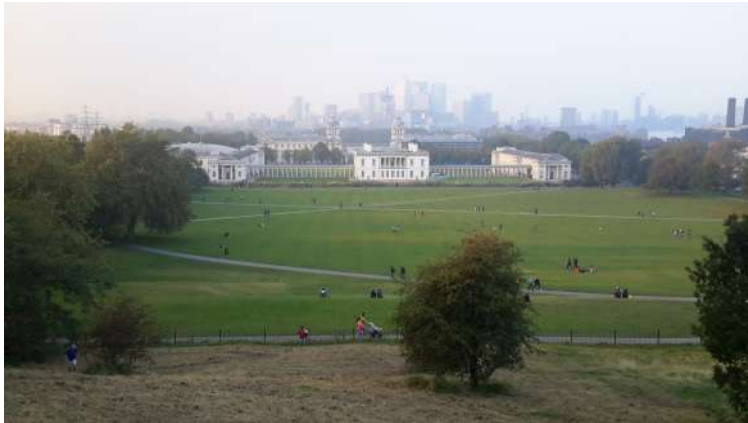
Queen's Royal Observatory