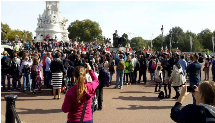
- marné čekání na výměnu stráží (důvod: nátěr prostoru před hlavním vstupem)